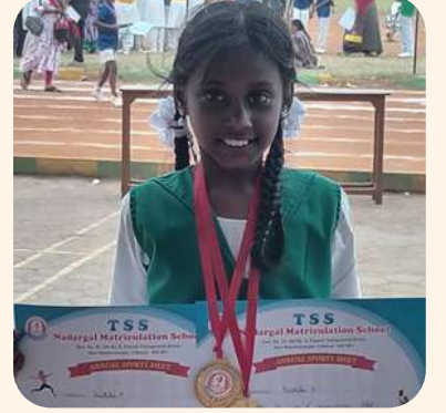
பிரிதிகா (சென்னை) ஸ்கிப்பிங் முதல் பரிசு.