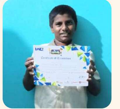
தர்ஷன் (வேலூர்) பள்ளி அளவில் நடைபெற்ற போட்டி.