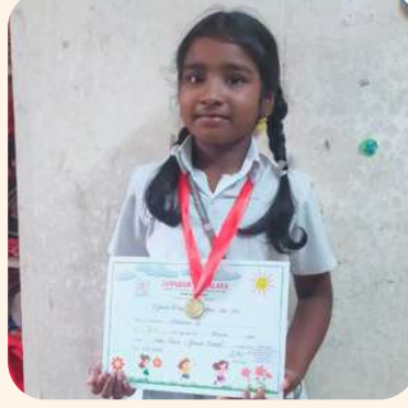
ஷனசா (சென்னை)வளைய ஓட்டப் போட்டி.