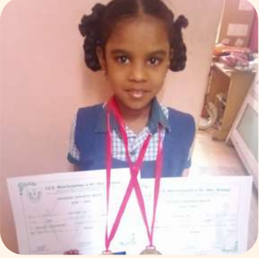
அக்சயா (சென்னை) ஓட்டப்பந்தயம் மற்றும் உருளைக்கிழங்கு சேகரித்தல் போட்டி.