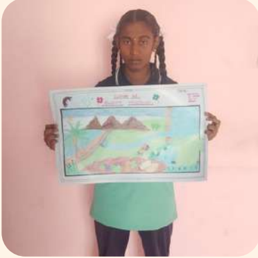
ஷர்மீனா (வேலூர்) ஓவிய போட்டி