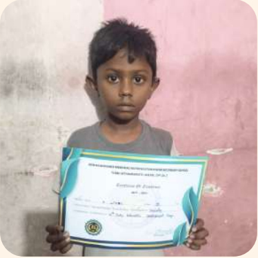
லிதின் (திருப்பத்தூர்) ஓவியப்போட்டி.