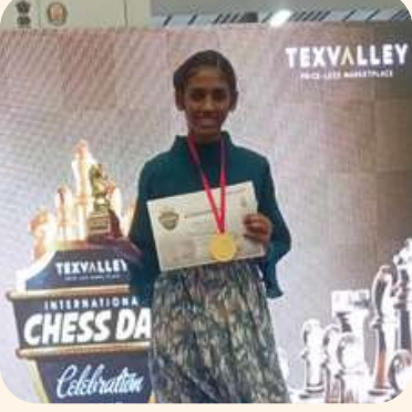
மகாவர்ஷினி (ஈரோடு) மாவட்ட அளவிலான சதுரங்க போட்டி