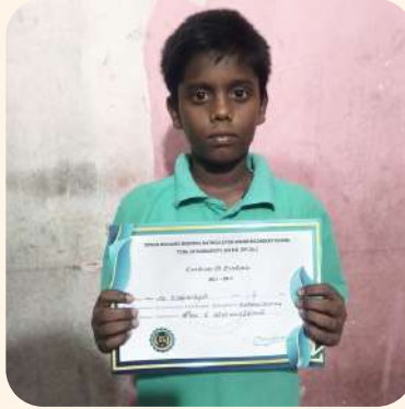
ரேணுகாந்தன் (திருப்பத்தூர்) கட்டுரை எழுதுதல் போட்டி