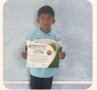
லிதீஸ் (தர்மபுரி) பள்ளி அளவிலான கல்வி தின பேச்சுப் போட்டி.