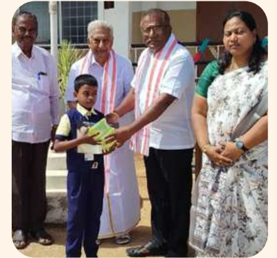
நித்திக் (நாமக்கல்) பேச்சுப் போட்டி - முதல் பரிசு.