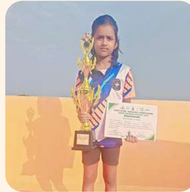
ஹெலினா (திருவள்ளூர்) மாநில அளவிலான யோகா போட்டியில் முதல் இடம்.