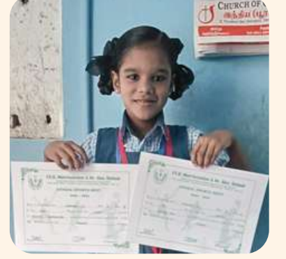
அக்ஷரா (சென்னை) ஓட்டப்பந்தயம் முதல் பரிசு மற்றும் உருளைக்கிழங்கு சேகரித்தல் போட்டி