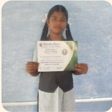
பிரார்த்தனா (தர்மபுரி) பள்ளி அளவிலான கல்வி தின பேச்சுப் போட்டி.